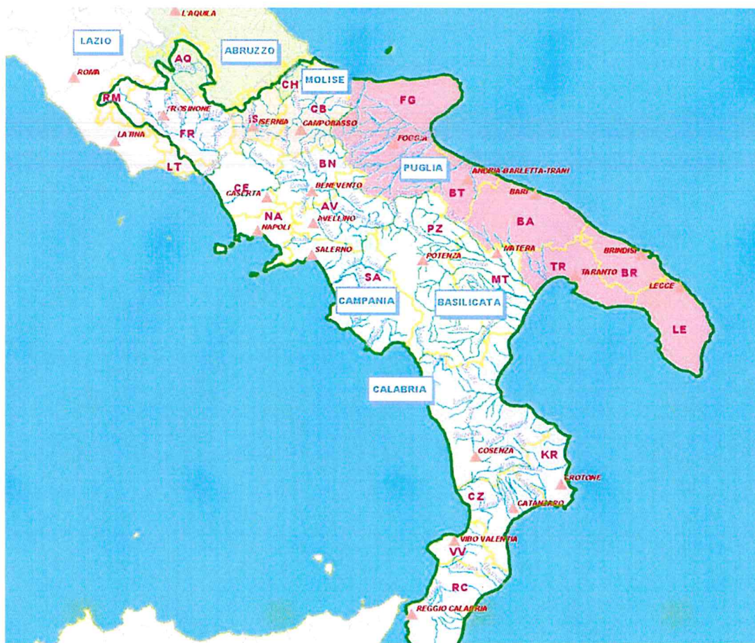
Fig. 1 Il Distretto dell'Appennino Meridionale (DAM)

Il territorio del Distretto Appennino Meridionale (DAM), è stato definito dall'art. 64 del D. Lgs. 152/2006 ed interessa complessivamente 7 Regioni (Basilicata, Calabria, Campania, Molise, Puglia e parte di Abruzzo e Lazio) e 25 Provincie (di cui 6, parzialmente).